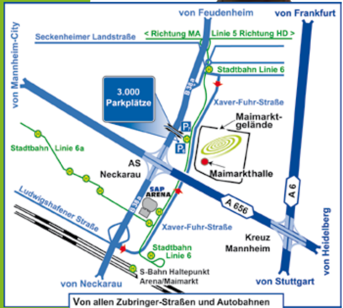
Von allen Zubringer-Straßen und Autobahnen klare Wegweisung zu den Besucherparkplätzen

22.-24. Feb. 2018 Für Einsteiger, Umsteiger, Aufsteiger!