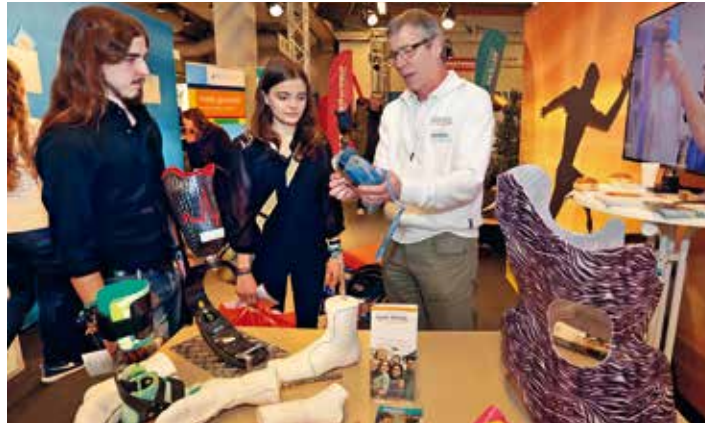
Drei Tage stehen die Experten an den Messeständen und in den Info-Foren persönlich Rede und Antwort!

Jobs for Future – der Hotspot für Arbeitsplätze, Aus- und Weiterbildung! Hier sind sie alle dabei: Familienunternehmen und Weltkonzerne, Universitäten, (Hoch-) Schulen, Akademien, Handwerkskammer, IHK, Agentur für Arbeit, Polizei, Bundeswehr, öffentlicher Dienst, Verbände, Regionalbüro für berufliche Fortbildung sowie Institutionen für Gesundheit und Soziales.